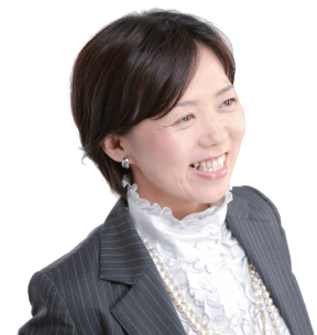
かりん不動産のわたなべです！

このほかにも「心得」が いろいろございます。 どうぞ店頭で、私たちエージェントに 直接ご質問ください。